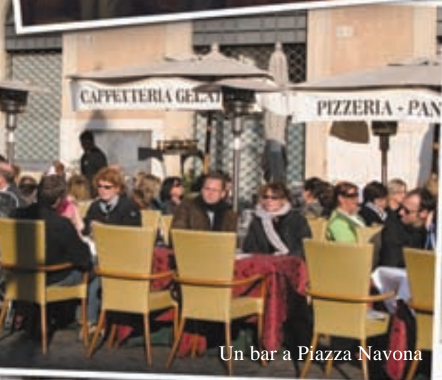
Un bar a Piazza Navona