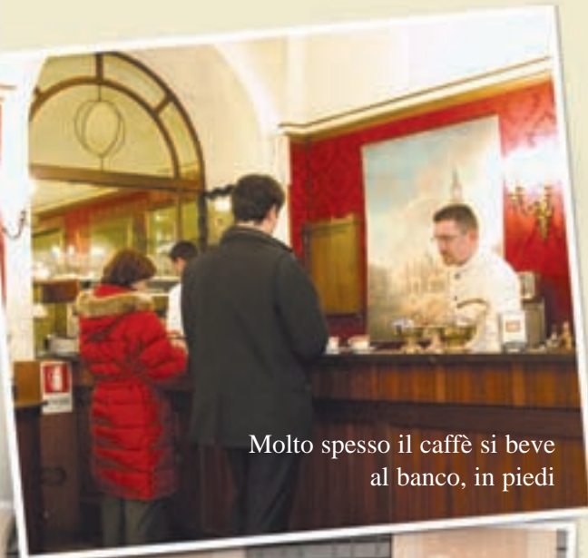
Molto spesso il caffè si beve al banco, in piedi

Leggete il testo e scegliete le affermazioni giuste.