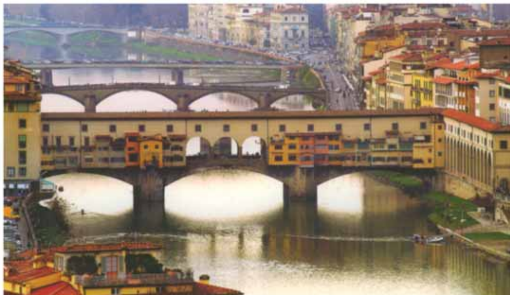
Il Ponte Vecchio, Firenze