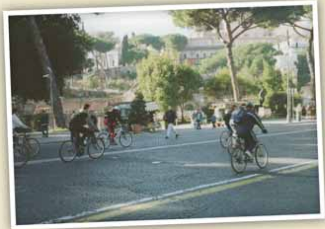
Una domenica senza macchine nel centro di Roma.