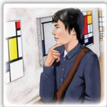
ad una mostra d'arte