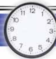
Sono le due meno cinque