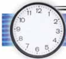
Sono le tre e venti