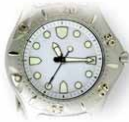
Sono le undici e un quarto