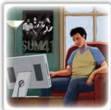
a guardare la tv

▶ B: accept or decline the invitations of A.