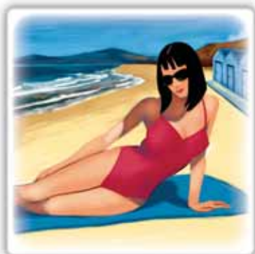
un fine settimana al mare