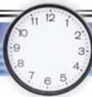
Sono le otto meno un quarto