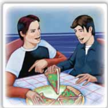
a mangiare la pizza