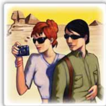
a fare le vacanze insieme