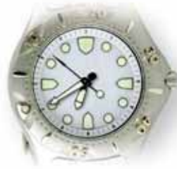
Sono le sette meno venti