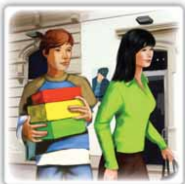
a fare spese insieme