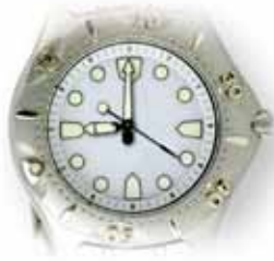
Sono le nove